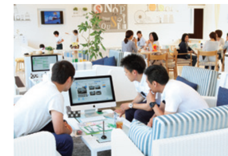
「ドルフィネット」を使った商談風景

今後も新たな成長機会の創出や、生産性の向上等、様々な場面で積極的にIT活用を進め、企業価値の向上を目指していきます。