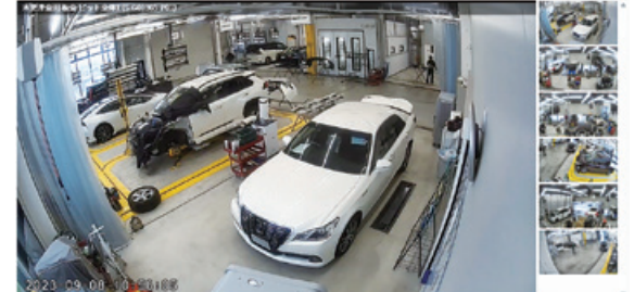
作業記録を閲覧できる映像