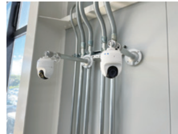
工場内に設置されたカメラ

当社は、より多くのお客様へ安心安全で質の高いサービスとおクルマに関するトータルケアを提供していきます。