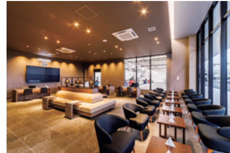
アフターラウンジ