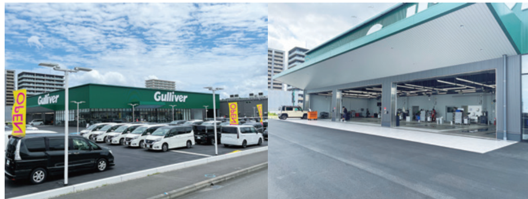
ガリバー大分店 〒870-0951 大分県大分市大字下郡3084番地6

今後も、2024年4月に上方修正をした中期経営計画に基づき、資本効率が高く成長の見込みが十分である大型店に経営資源を集中させ、2027年2月期末までに大型店100店舗に向けて出店を加速してまいります。